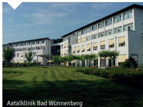
Aatalklinik Bad Wünnenberg